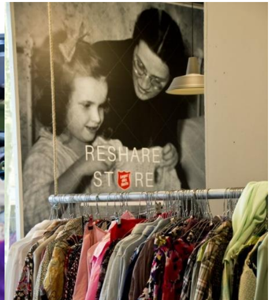
Ingezamelde kleding wordt verkocht