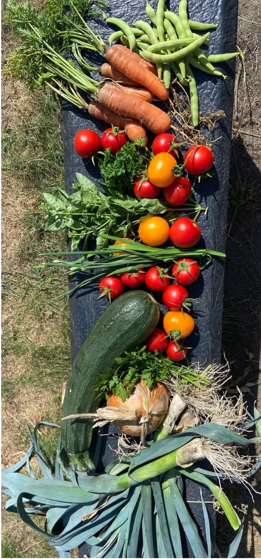
Les 5 inspectie bodembewoners