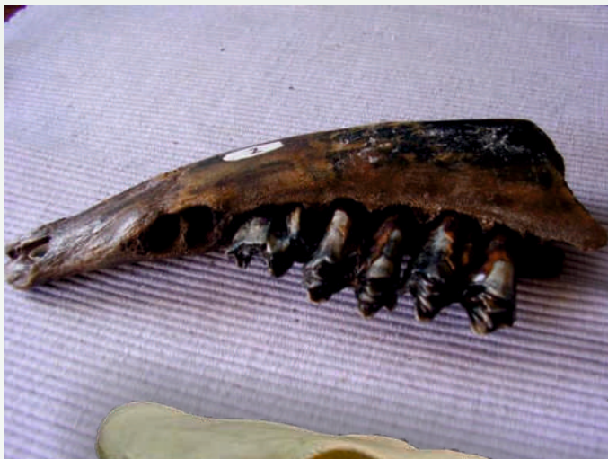
kaak van een koe met tanden