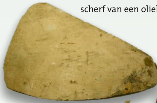
scherf van een oliekruik met maatinhoud