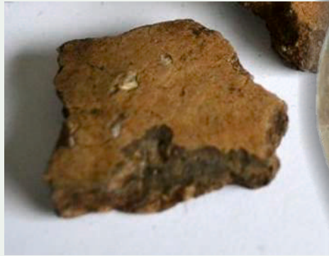
scherf van een pot van aardewerk