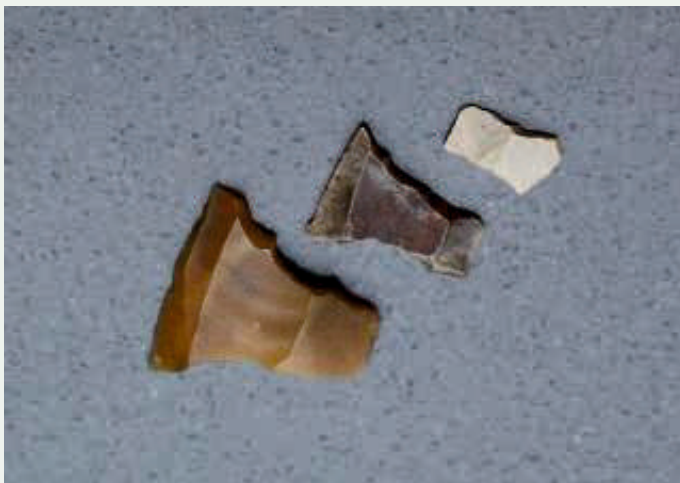
pijlpunt, gemaakt van vuursteen