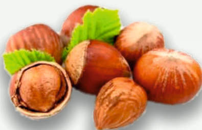
hazelnoten, deels verkoold