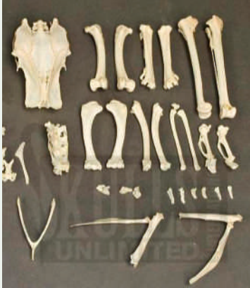
botjes van een kip