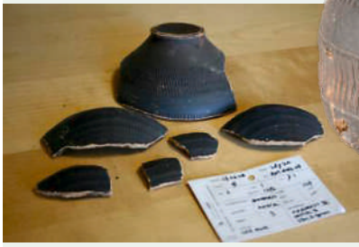
scherven van een zwarte drinkbeker